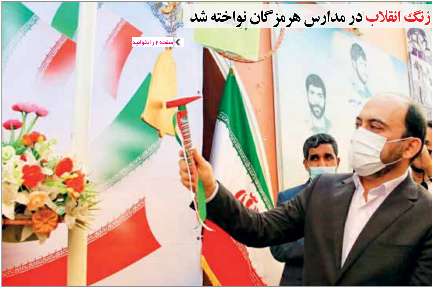
مدیرعامل شرکت تولید برق هرمزگان خبر داد