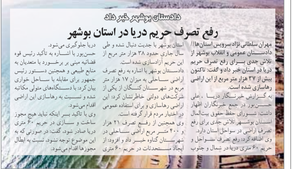
دادگستری بوشهرگیر دگاه