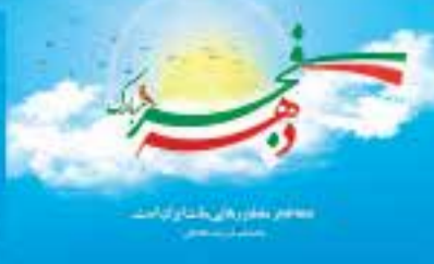
صفحهٔ عنوان مجله در سال ۱۳۸۰.

فرارسیدن سالروز ورود امام خمینی(ره) به ایران اسلامی و آغاز دهه فجر دهه می‌رسیدن به اوج بلندی و قدرت بر شما مبارک