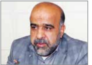
گروه خبر // مدیرکل امور مالیاتی

موضوع پرداخت. مریدی گفت: در مواردی که اشخاص واردکننده به موجب قرارداد چنانچه اشخاص واردکننده با اسناد به دفاتر و اسناد و مدارک مثبت به عنوان حق العمل کار اقدام به واردات و ترخیص کامیون های مستعمل برای سایر اشخاص (به عنوان امر) می نمایند، اشخاص واردکننده (حق العمل کار) می بایست مالیات و عوارض ارزش افزوده را صرفاً نسبت به مبلغ حق العمل دریافتی، محاسبه و ضمن درج در