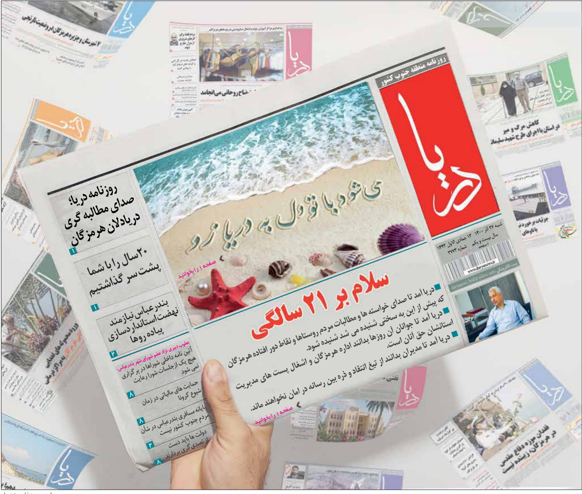
طرح: محمد زارعی/دريا