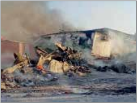
آتش سوزی در سایت دریایی منطقه ویژه صنایع انرژی بر پارسیان