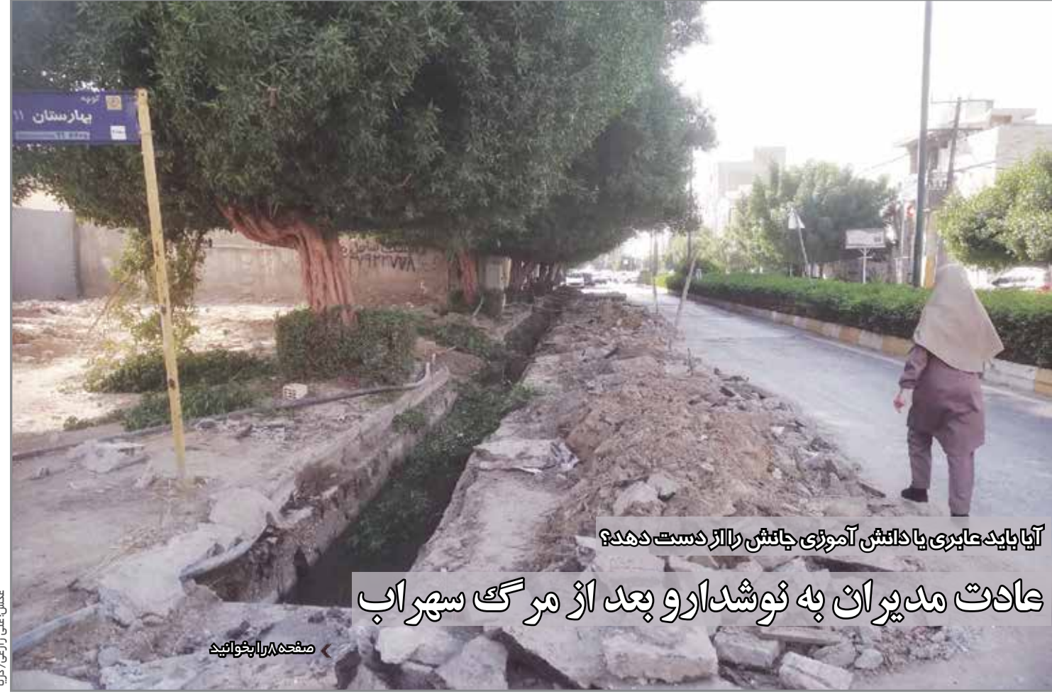
آیا باید عابری یادداشت آموزشی جانش را از دست دهد؟