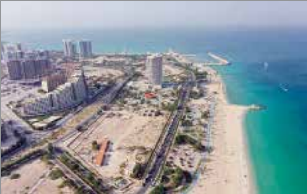
نمای هوایی از پروژه توسعه مسکن جزیره کیش در راستای احداث ۲۵ هکتار واحد مسکونی در جزیره کیش