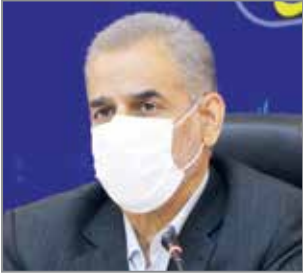
حسن سیلاوی سرویس استان ها // استاندار

خوزستان گفت: مسائلی این استان قابل حل شدن هستند و نیاز است برای حل آنها تصمیمات به‌موقع گرفته‌شود.