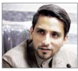
یغیوقوب دبیری نژاد مدیرمسئول

هرمزگان است. مدیران استانی نیز برای حفظ جایگاه خود به صفحات فضای مجازی و اخبار رسانه ها چشم دوخته اند تا مسادا از قافله تعریف و تمجیدها از استاندار آینده غافل بمانند. اما در وسط همه این التهابات موضوعات مهم و معیشت مردم در حاشیه قرار گرفته است. انگار نه انگار این آقایان هنگام قرار گرفتن پشت تریبون و در سخنرانی هایشان آنچنان دم از مردم می زنند که اشک مخاطب جاری می گردد. ظاهراً موضوع انتخاب استاندار استان هرمزگان در گیر پادشاهان رفته است ساکنین محلات حاشیه ای شهر بندرعباس همچون نخل پیرمرد، درخت سبز، شاهد و ... چند هفته است که کمتر از یک روستا به آب شرب دسترسی دارند. ظاهراً موضوع انتخاب استاندار آقندر مهم است که خبر رکورد شکنی پایتخت به اصطلاح اقتصادی کشور در شاخص