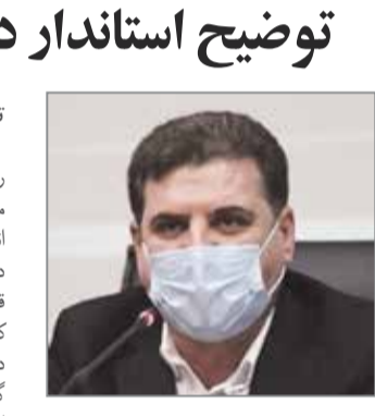
آرزو توکلی سرویس استان ها // رئیس دانشگاه علوم پزشکی کرمان با اشاره به برگزاری نشست تصمیم سازی با حضور فرمانده انتظامی استان از برنامه ریزی برای اجرای طرح واکسیناسیون خودرویی خبر داد.

آرزو توکلی سرویس استان ها // استاندار کرمان درباره سرنوشت پروژه های نیمه تمام از جمله تالار مرکزی و کاروانسرای وکیل گفت: در پروژه تالار مرکزی کارها در حال انجام و تقریباً تمام شده‌است و کاروانسرا وکیل نیز اختلافی در قرارداد داشتیم که دو جلسه مفصل در تهران داشتیم و در آستانه