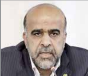
گروه خبر // مدیرکل امور مالیاتی اظهارنامه مالیاتی اشخاص حقوقی و صاحبان درآمد املاک اجاری به استناد