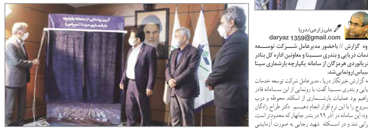
گروه گزارش // با حضور مدیرعامل شرکت توسعه خدمات دریایی و بندری سینا و معاونین اداره کل بندر و دریانوردی هرمزگان از سامانه یکپارچه بارشماری سینا (سیباس) رونمایی شد.