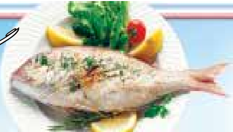
طرح : بیثا هوشنگی