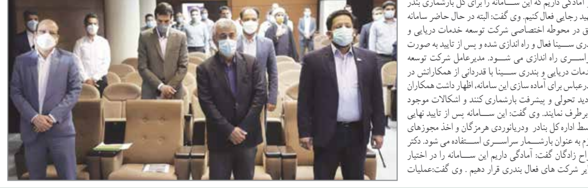
انجام شد. دکتر طراح زادگان اظهار داشت: در حال حاضر نیز آمادگی داریم که این سامانه را برای کل بارشماری بندر شهید رجایی فعال کنیم. وی گفت: البته در حال حاضر سامانه فوق در محوطه اختصاصی شرکت توسعه خدمات دریایی و بندری سینا فعال و راه اندازی شده و پس از تایید به صورت سرسری راه اندازی می‌شود. مدیرعامل شرکت توسعه خدمات دریایی و بندری سینا با قدرانی از همکارانش در بندرعباس برای آماده‌سازی این سامانه، اظهار داشت همکاران باید دید تحولی و پیشرفت بارشماری کنند و اشکالات موجود را برطرف نمایند. وی گفت: این سامانه پس از تایید نهایی توسط اداره کل بندر و دریانوردی هرمزگان و اخذ مجوزهای لازم به عنوان بارشماری سرسری استفاده می‌شود. دکتر طراح زادگان گفت: آمادگی داریم این سامانه را در اختیار سایر شرکت‌های فعال بندری قرار دهیم. وی گفت: عملیات