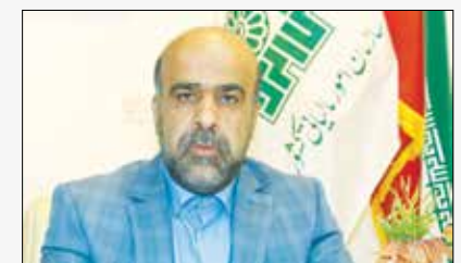
مدیر کل امور مالیاتی هرمزگان خبر داد

گروه خبر // رئیس جمهوری گفت: که تحریم‌ها علیه ملت ایران باید لغو گردد و از هر طرح دیپلماتیک که باعث انجام این امر شود استقبال می‌کند. حجت الاسلام و المسلمین سید ابراهیم رئیسی سیزدهمین رئیس جمهوری اسلامی ایران در مراسم تحلیف که در محل مجلس شورای اسلامی برگزار شد، با خوشامدگویی به میهمانان داخلی و خارجی حاضر در این مراسم، اظهار کرد: طلوع انقلاب اسلامی در ایران فصل نویی از آزادی مشارکت سیاسی و مردم‌سالاری را در تاریخ کشور به ثبت رساند و قانون اساسی به عنوان میثاق ملی همه نهادهای حاکمیتی را محصول اراده و رای مردم دانسته است و امروز بار دیگر این موضوع تحقق یافته است. اراده مردم به تحقق عدالت، پیشرفت، آزادی است. وی افزود: ملت ایران به واسطه انقلاب اسلامی زنجیر زورگویان را پاره کرد و بر سر نوشت خود حاکم شد و ثابت کرد که با وجود همه مشکلات و تحریم‌ها، ملت ایران توانسته است در مسیر پیشرفت و توسعه گام‌های بزرگی بردارد.