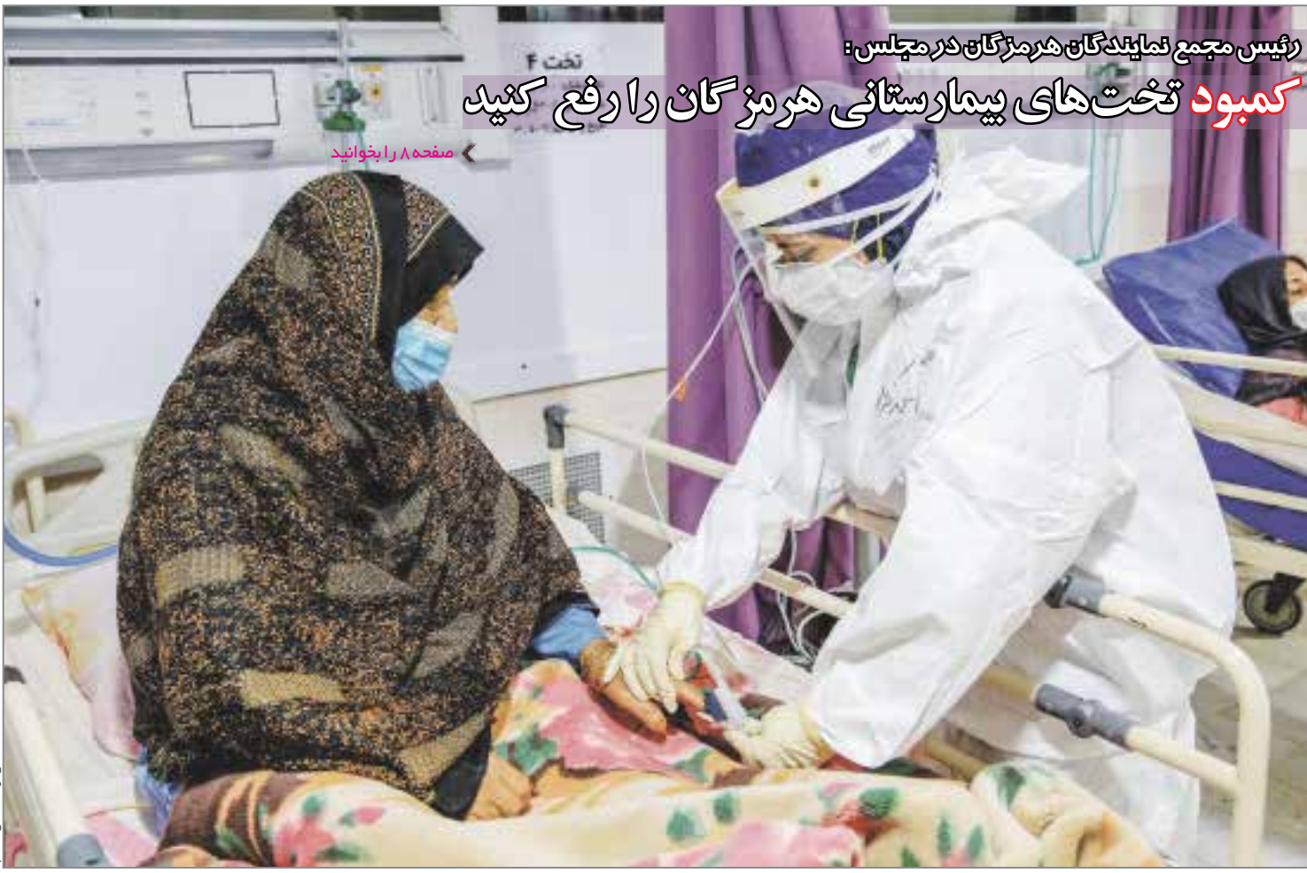
رئیس مجمع نمایندگان هرمزگان در مجلس: کمبود تخت‌های بیمارستانی هرمزگان را رفع کنید