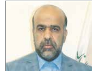
گروه خبر // مدیرکل امور مالیاتی هر مزگان با بیان اینکه ۱۱۶ درصد درآمدهای این استان در سال گذشته

محقق شده، میزان درآمدهای هر مزگان در استان هر مزگان را نیز هشت هزار و ۵۰۰ شرکت اعلام کرد. وصول درآمدهای هر مزگان در سال گذشته، ۹۲ درصد آن برعهده اداره کل امور مالیاتی و هشت درصد نیز برعهده سایر دستگاهها بود که از این ۹۲ درصد درصدی نسبت به سال قبل تر آن (۹۸) که ۵۲۱ میلیارد تومان بود، بین شهرداری‌ها و دهیاری‌های استان هر مزگان توزیع شد. محقق شده، میزان درآمدهای هر مزگان در استان هر مزگان را نیز هشت هزار و ۵۰۰ شرکت اعلام کرد. وصول درآمدهای هر مزگان در سال گذشته، ۹۲ درصد آن برعهده اداره کل امور مالیاتی و هشت درصد نیز برعهده سایر دستگاهها بود که از این ۹۲ درصد درصدی نسبت به سال قبل تر آن (۹۸) که ۵۲۱ میلیارد تومان بود، بین شهرداری‌ها و دهیاری‌های استان هر مزگان توزیع شد.