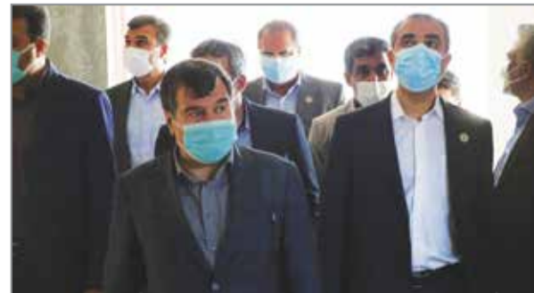
گروه خبر // استاندار استان هرمزگان خود از ساختمان در حال احداث اتاق به همراه معاونین اقتصادی و عمرانی بازرگانی بندرعباس بازدید کردند.

این نخستین دیدار استاندار از اتاق بازرگانی بندرعباس بود که در دوره های قبلی چنین رویدادی محقق نشده بود. رایزنی های استانی و ملی اتاق بازرگانی بندرعباس در دور نهم فعالیت های نمایندگان به قدری قوی و کارآمد است که اتاق را نسبت به سایر استانهای دارای کرسی و جایگاهی ثابت نموده است و این نخستین باری است که استاندار وقت از اتاق بازرگانی بندرعباس بازدید کرده است. استاندار هرمزگان در حاشیه این بازدید و در نشست فوق العاده شورای گفتگو دولت و بخش خصوصی اذعان داشت که اتاق