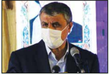
اسلامی - وزیر راه و شهرسازی