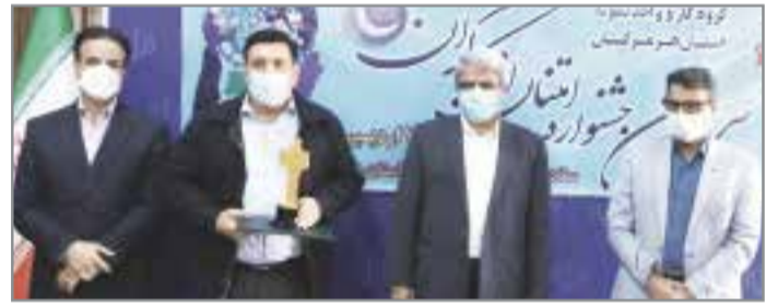
ادامه از تیتربیک// ابراهیمی، عنوان کرد: تعداد ۹۴۵ نفر در قالب کارگر و گروه کار و واحد نمونه در سامانه ثبت نام کرده اند که پس از داوری، کارگران و گروههای کار و واحد نمونه

آلومینیوم المهدی، واحد نمونه سال ۹۹ شد کارگران، توجه ویژه به امر آموزش، توجه به محیط تحقیق و توسعه و دارا بودن واحد R&D، اجرای دستورالعمل های حفاظتی و بهداشت کار و ایفای نقش مسئولیت پذیری اجتماعی، بعنوان واحد نمونه معرفی و از مدیر عامل این شرکت تجلیل شد. لازم به ذکر است، طبق آمار و ارقام تولیدی آلومینیوم المهدی زمانی که مدیریت این شرکت در بهمن ماه سال ۹۷ به گروه مینا واگذار شد تولید یک ماه گذشته این مجموعه چهار هزار تن بود که این رقم در سال ۹۸ به ۸۷ هزار تن رسید. این شرکت تولیدی مهم در سال ۹۹ با تلاش و همت مضاعف مجموعه خود و با افزایش دیگ های تن رساند که این افزایش تولید، رشد ۸۸ درصدی را نشان می دهد که بیانگر مدیریت و اراده قوی و جهادی این مجموعه تولیدی در جهت تحقق رونق تولید و اشتغالزایی است و مقام معظم رهبری هم در پیام نوروزی خود به جشن تولید در حوزه آلومینیوم اشاره داشتند. طبق گفته مدیران این شرکت، برنامه تولید این شرکت در سال ۱۴۰۰ تولید ۲۲۰ هزار تن را در برنامه دارد که رقم بسیار بالایی است که اگر این مقدار تولید صورت گیرد شاهد تحول و جهش بسیار خوبی در این صنعت خواهیم بود. این شرکت تولیدی توجه به صنایع پایین دستی در زمینه رونق تولید، اشتغال جوانان را جزء اهداف و برنامه های اصلی این شرکت می داند که در این راستا متأسفانه در استان هرمزگان نزدیک به ۲۰ سال از احداث و فعالیت شرکت آلومینیوم می گذرد و فقط تعداد دو واحد پایین دست از ضایعات این کارخانه استفاده می کنند دایر هستند که آن هم از شمش این صنعت استفاده نمی کنند. بر اساس اظهارات مدیران شرکت آلومینیوم المهدی این شرکت در سال جاری مصمم است، برای تحقق شعار سال، رونق تولید در