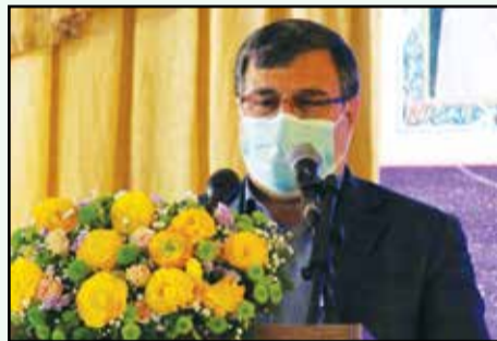
همتی - استاندار هرمزگان