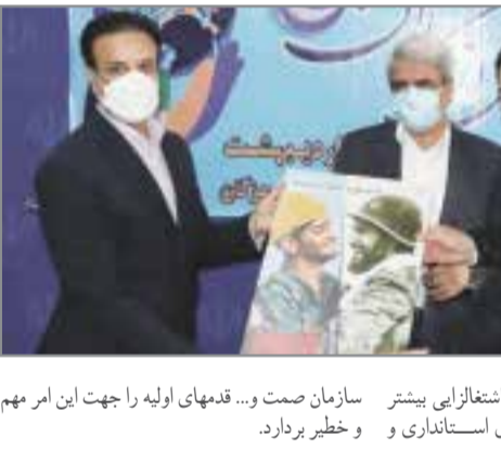
بخش های صنایع پایین دستی و اشتغالزایی بیشتر سازمان صمت و... قدمهای اولیه را جهت این امر مهم جوانان قصد دارد با حمایت های استانداری و و خطیر بردارد.