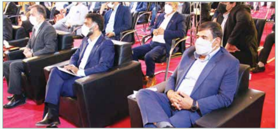
اسلامی در این شهر آغاز شد. هر واحد مسکن این طرح ملی بین ۱۰۰ تا ۱۵۰ متر مساحت خواهد داشت و در مدت ۴۸ ماه حدامی شوند و در ۶۰۵ بلوک ساختمانی طراحی شده اند. این بزرگترین طرح احداث و عرضه مسکن کشور به ششماه می رود که با سرمایه گذاری افزون بر ۷ هزار میلیارد تومان در رویه روی مجتمع بانکداران بندرعباس اجرا می شود. وزیر راه و شهرسازی در این آغاز عملیات اجرایی