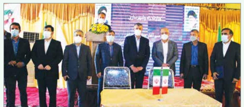
گروه گزارش / احداث ۱۰ هزار واحد مسکن ملی هرمزگان با حضور وزیر راه و شهرسازی، استاندار هرمزگان و نمایندگان مردم بندرعباس در مجلس شورای