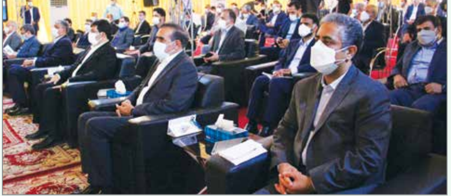
اسلامی در این شهر آغاز شد. هر واحد مسکن این طرح ملی بین ۱۰۰ تا ۱۵۰ متر مساحت خواهد داشت و در مدت ۴۸ ماه حدامی شوند و در ۶۰۵ بلوک ساختمانی طراحی شده اند. این بزرگترین طرح احداث و عرضه مسکن کشور به ششماه می رود که با سرمایه گذاری افزون بر ۷ هزار میلیارد تومان در رویه روی مجتمع بانکداران بندرعباس اجرا می شود. وزیر راه و شهرسازی در این آغاز عملیات اجرایی