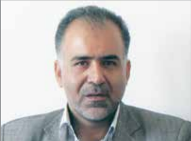
اسدیپور - مدیر تعاون روستایی هرمزگان