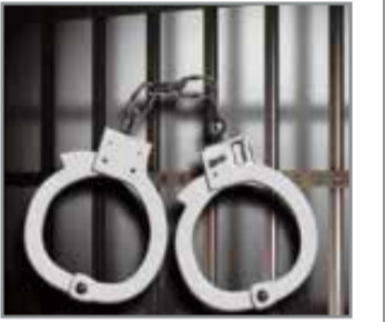
نوار سبز پلیس در اوج تظاهرات خیابانی

سرویس حوادث// فرمانده انتظامی استان مرکزی از دستگیری سه تبه افغانستان که نوجوان ۱۲ ساله‌ای را از این کشور ربوده و به شهرستان اراک منتقل کرده بودند، خبر داد.