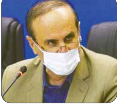
استان خوزستان در ایران

حسن سیلوی سرویس استان ها //استاندار خوزستان گفت:وحشت ما از این است که علاوه بر اینکه انتشار ویروس جهش‌یافته کرونا در خوزستان تشدید شده، به استان‌های دیگر نیز سرایت کند و دیگر از دست کشور، ستاد ملی مقابله با کرونا و دولت کاری برنماید.بنابراین محدودیت‌های حداقل یک هفته‌ای اعمال خواهد شد.