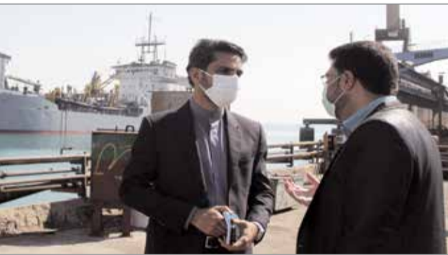
کاملاً بومی سازی شده و توسط نیروهای داخلی انجام می‌پذیرد. سرمایه‌گذاری عظیمی که اینجا برای به وجود آوردن این چنین زیرساخت‌های بزرگ و ارزشمندی صورت گرفته می‌تواند پرگ برنده‌ای برای کشور در پیشبرد اهداف اقتصاد مقاومتی باشد. ایزوایکو در توسعه‌ی مبادین گازی کشور نقش اساسی داشته است و با طراحی و ساخت سکوهای گازی و نفتی و همچنین تعمیرات اساسی ریگ‌های حفاری در بالا بردن توان برداشت عملاً ثابت کرده است که اگر نگاه به داخل وجود داشته باشد صنعت داخل کشور می‌تواند کارهای بزرگی را به انجام برساند. مجتمع اقتصادی معتبر و شناخته شده کشتی‌سازی خلیج فارس با زیرساخت‌های مختلف در طول چهار دهه اخیر، افت و خیزهای فراوانی به خود داشته، ابتدا با تعمیر کشتی‌های کوچک و بزرگ روی آورده و مسی‌رود تا به صنعتی پیشرو در صنایع دریایی ایران تبدیل شود. سعید قادری مدیر