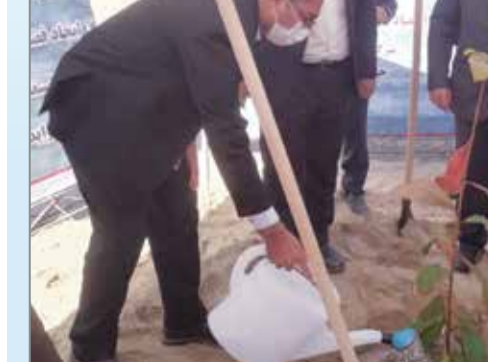
سال جشن تولید | معتمد و مرئوسای پروژه | رئیس کل دادگستری هرمزگان | استاندار هرمزگان | فرماندار بندرعباس | مدیرعامل شرکت معماران تجارت آفتاب