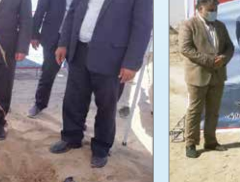
سال جشن تولید | معتمد و مرئوسای پروژه | رئیس کل دادگستری هرمزگان | استاندار هرمزگان | فرماندار بندرعباس | مدیرعامل شرکت معماران تجارت آفتاب