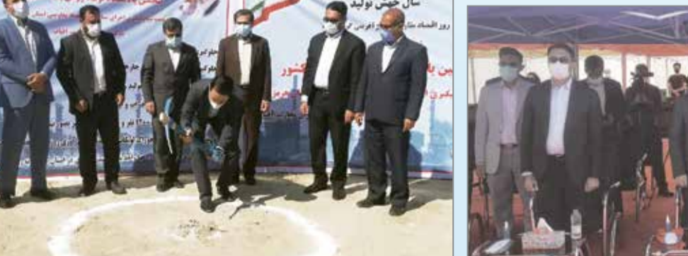
سال جشن تولید | معتمد و مرئوسای پروژه | رئیس کل دادگستری هرمزگان | استاندار هرمزگان | فرماندار بندرعباس | مدیرعامل شرکت معماران تجارت آفتاب

بروز هم با همراهی دستگاه قضایی کشور و استان، امروز وارد فاز اجرا شده است که از مسئولان قضایی جای قدرانی داردهمتی افزود: در حوزه صادرات با همراهی دستگاه قضایی، بسیاری از مشکلات در استان برطرف شده است. وی تصریح کرد: به مدیران دستگاه های اجرایی که دغدغه عواقب برخی