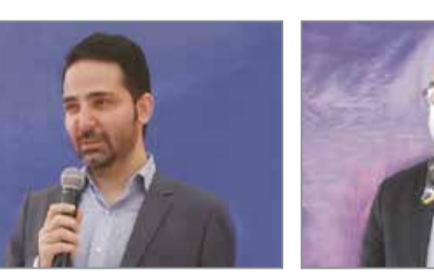
دوستی ؛ مدیرعامل شرکت معماران تجارت آفتاب

فریدون همتی با قدرانی از ریاست قوه قضائیه و رئیس کل دادگستری استان و دادستان بندرعباس و اینکه سیستم قضایی در کنار دستگاه های اجرایی و خصوصی است، افزود: با حمایت از بخش خصوصی و سرمایه گذاران، آنها در حوزه تولید و سرمایه گذاری می کنند و اشتغالزایی و... را به همراه دارد که این دانست واز مدیرعامل شرکت تجارت آفتاب قدرانی کرد. وی افزود: بهره برداری از این پالایشگاه، اشتغالزایی، رونق تولید و اقتصادی را به همراه خواهد داشت. استاندار هرمزگان تأکید کرد بایستی به بخش خصوصی تکیه کنیم و آن را رقیب ندانیم و سرمایه گذاری بخش خصوصی باعث افزایش بهره وری، کاهش فساد، توانمندی کشور و... خواهد شد.