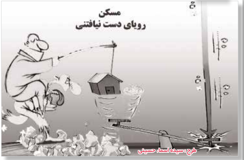
طرح: سپیده اسماء حسینی