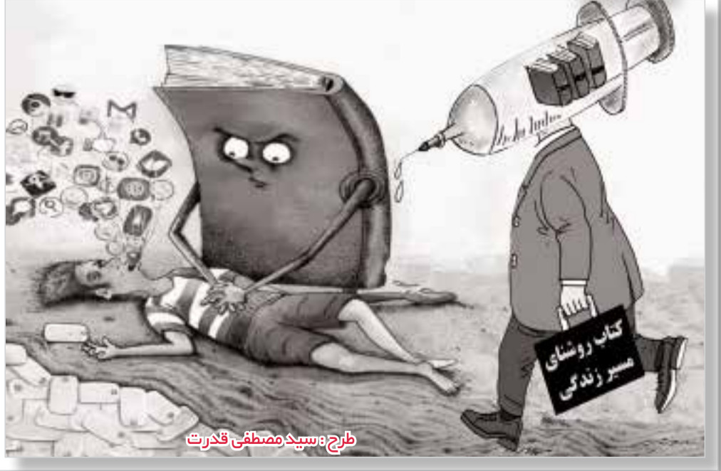
طرح: سپیده مصطفی فقرت