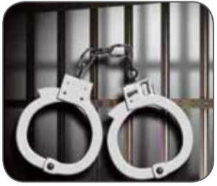
سرسویس حوادث// رئیس کل دادگستری استان فارس از بازداشت بخشدار مرکزی