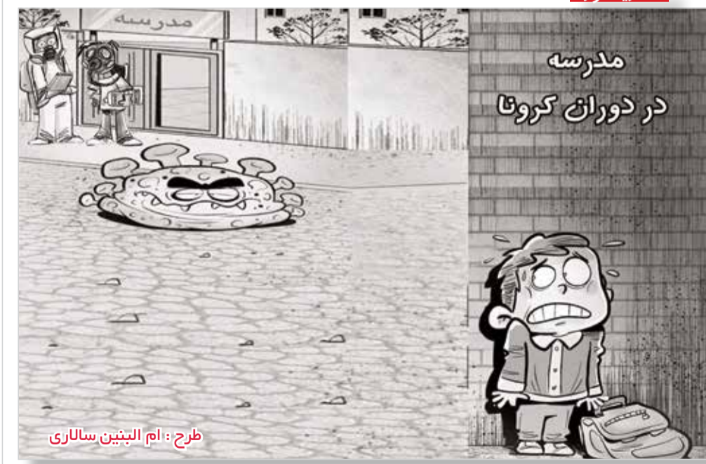
طرح: ام البنین سالاری