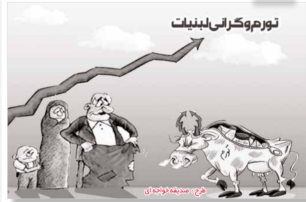
طرح: صدیقه خواجه ای