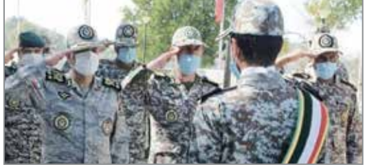
گروه خیبر // فرمانده کل ارتش گفت: یکپارچه پدافند است بوده و تمامی تحرکات دشمن با دقت و حساسیت بیش از پیش رصد نقاط راهبردی و حساس پدافندی در شبکه