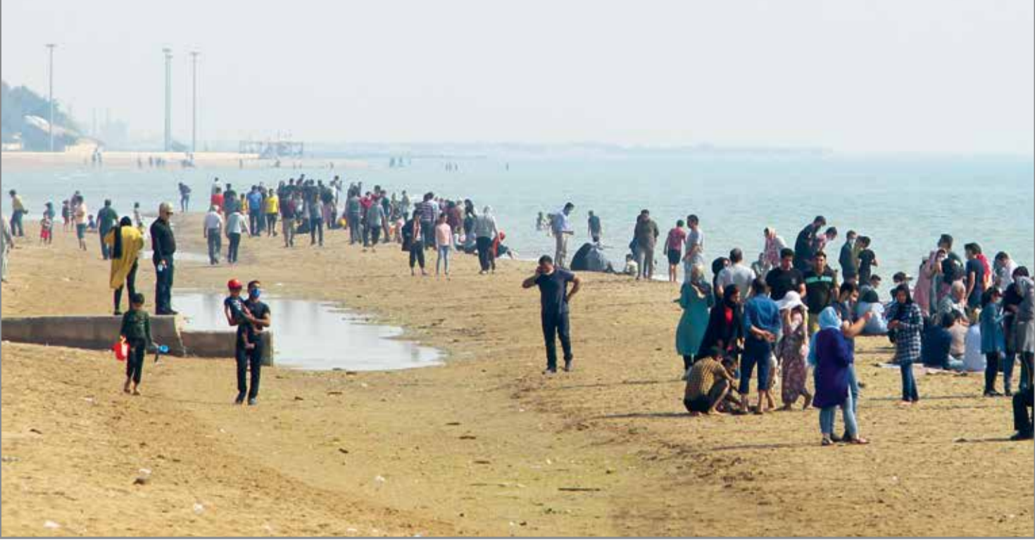
عکس امین ازعباس دریا

روزنامه دریا صدای مردم را به گوش مسئولان می رساند