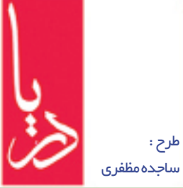
گروه مطبوعاتی دریا