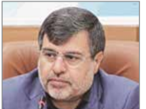
ادامه تیتیر یک //

تجمعی صورت گیرد و نیروی نظامی همان‌طور که تاکنون نسبت به اعمال محدودیت ها اقدامات مناسبی داشته، همچنان این روند را ادامه دهد. وی با بیان اینکه برای شیب یلدا دغدغه جدی وجود دارد، اظهار داشت: از مردم شریف هرمزگان می‌خواهیم، در شب یلدا هرکس حتما در خانه خود بماند و از برگزاری هرگونه مهمانی، دورهمی و مراسم در این شب به طور جدی پرهیز و خودداری شود و هیچ‌گونه دید و بازدیدی صورت نگیرد. استاندار هرمزگان با تاکید بر اینکه دستگاه‌های اجرایی باید به طور جدی پروتکل های بهداشتی را رعایت کنند، خاطرنشان کرد: تمامی مدیران کل دستگاهها، سازمان ها و نهادها، فرمانداران، بخشداران و دهیاران در این زمینه مسئولیت جدی بر عهده دارند و ضمن رعایت اصول بهداشتی، هیچ مراسمی نباید توسط دستگاهها برگزار شود و جلسات نیز باید در حد ضرورت و با حضور محدود افراد باشد. همتی گفت: فرمانداران با همکاری نیروی نظامی باید همچنان با قاطعیت، رصد و نظارت لازم در خصوص اعمال محدودیت‌های مقابله با کرونا را داشته باشند و در هر جایی که نیاز بود، برخورد قانونی با تخلفات صورت گیرد. وی با تشکر و قدردانی از ایثار و تلاش های شبانه‌روزی تمامی پزشکان، پرستاران و