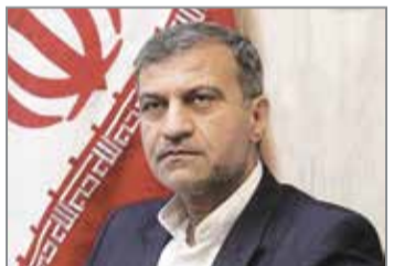
گروه خبر // نایب رئیس کمیسیون انرژی مجلس گفت: واگذاری اراضی مستعد پرورش میگو به صیادان بومی و توانمند استان هرمزگان، در اولویت قرار دارد. او افزود: واگذاری ها باید به افراد توانمند و با اولویت صیادان بومی استان باشد. وی افزود: مطالعات لازم در این زمینه انجام شده و به زودی این واگذاری ها در راستای تقویت معیشت صیادان بومی صورت خواهد گرفت. استاندار هرمزگان تصریح کرد: با محوریت سازمان همیاری شهرداری ها و دهیاری های استان، یکپارچه سازی این اراضی با نظارت نظام مهندسی کشاورزی و مشاوران این طرح انجام می شود.

به گزارش خبرنگار دریا؛ احمد مرادی نایب رئیس کمیسیون انرژی مجلس گفت: واگذاری اراضی مستعد پرورش میگو به صیادان بومی و توانمند استان هرمزگان، در اولویت قرار دارد. او افزود: واگذاری ها باید به افراد توانمند و با اولویت صیادان بومی استان باشد. وی افزود: مطالعات لازم در این زمینه انجام شده و به زودی این واگذاری ها در راستای تقویت معیشت صیادان بومی صورت خواهد گرفت. استاندار هرمزگان تصریح کرد: با محوریت سازمان همیاری شهرداری ها و دهیاری های استان، یکپارچه سازی این اراضی با نظارت نظام مهندسی کشاورزی و مشاوران این طرح انجام می شود.