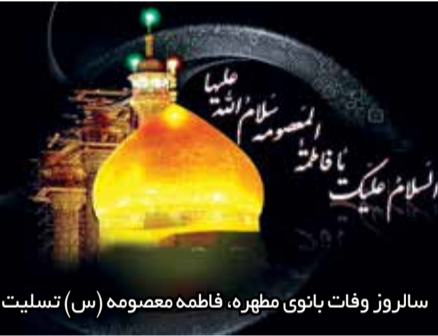
سالروز وفات بانوی مظهر، فاطمه معصومه (س) تسلیت