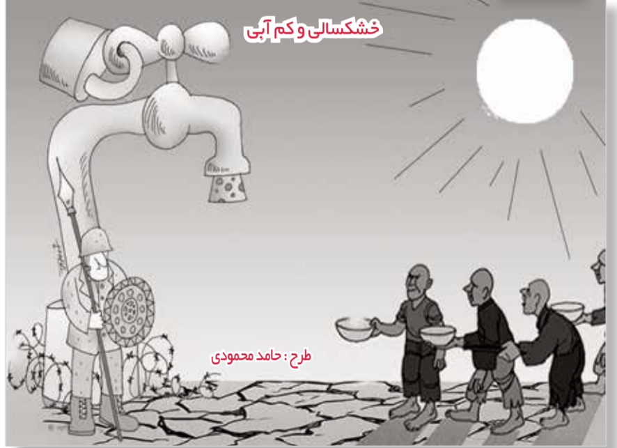
طرح: حامد محمودی