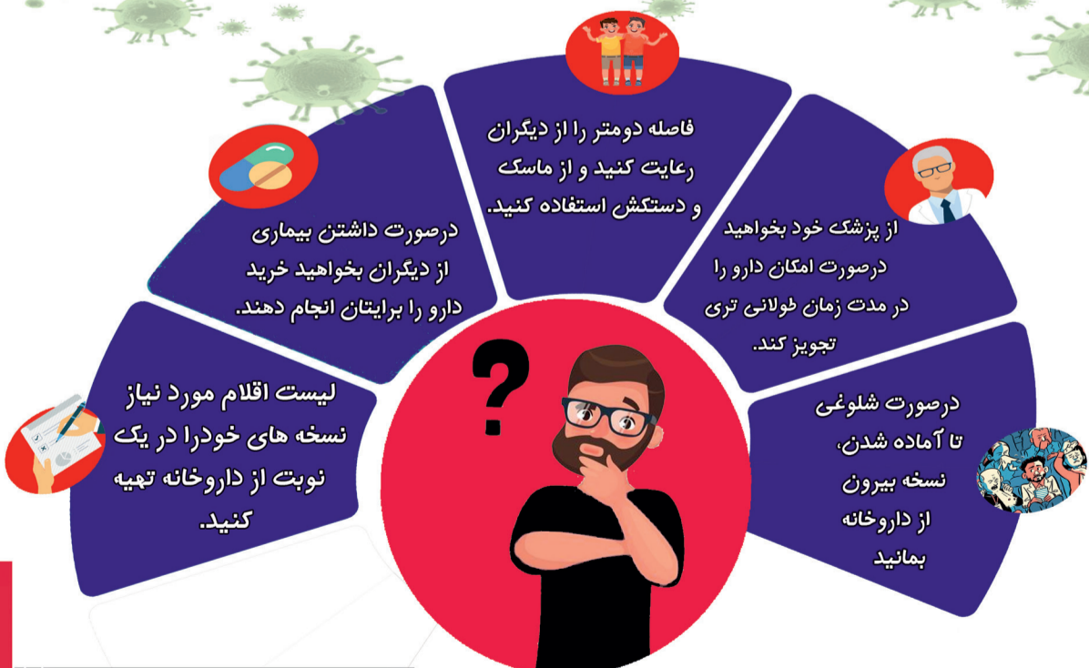
طرح: امیر کاربخش