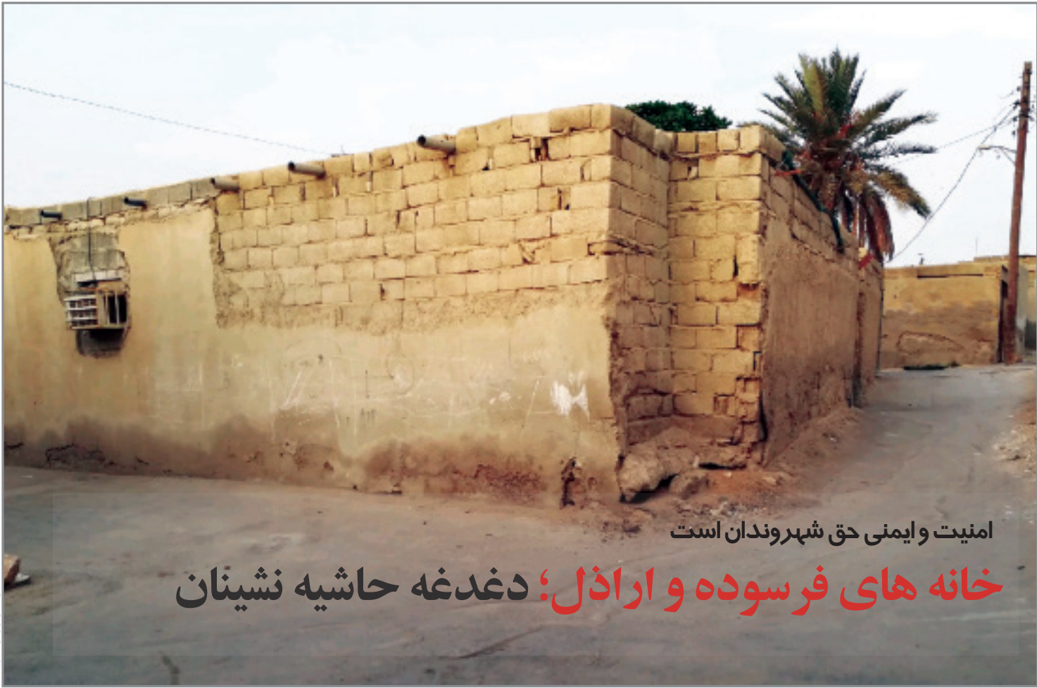
امنیت و ایمنی حق شهروندان است