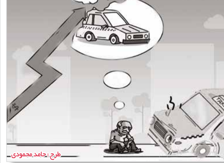
نرخ خودرو طرح: حامد محمودی