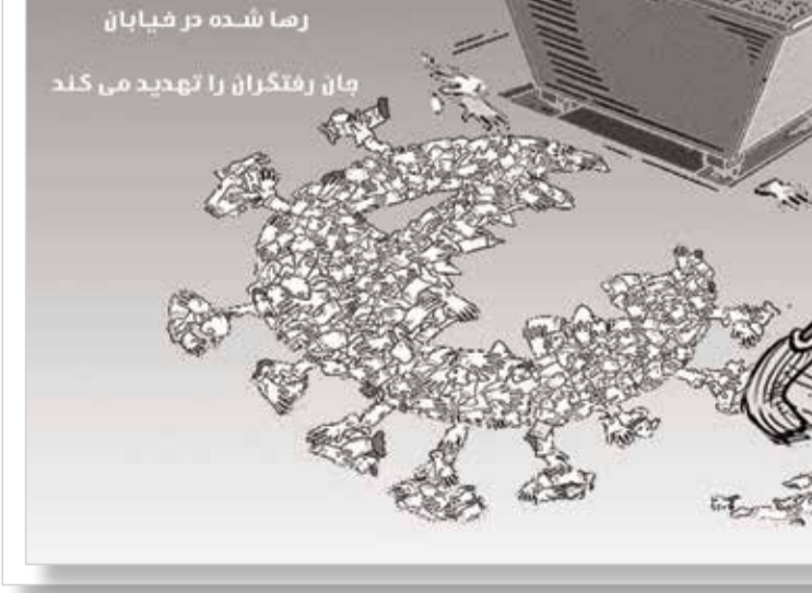
طرح: حامد محمودی