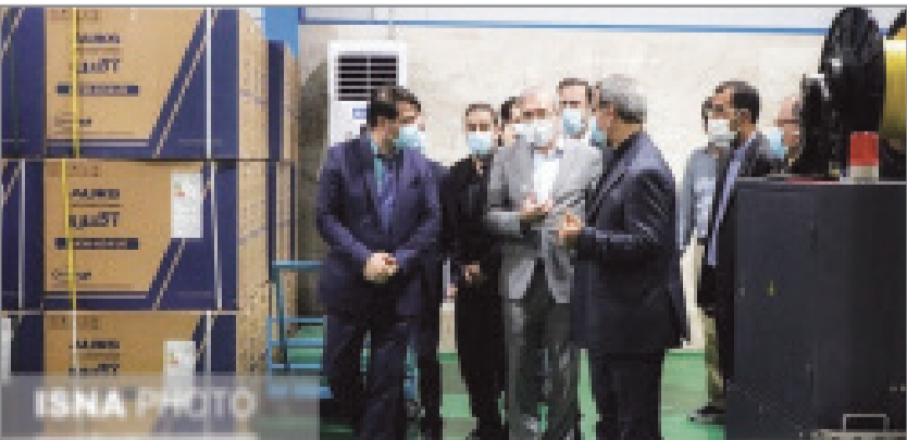
رئیس‌جمهور و اعضای هیئت مدیرعامل سازمان منطقه آزاد کیش گفت: با افتتاح ۱۱ طرح عمرانی و زیر بنایی از طریق ویدئو کنفرانس توسط رئیس‌جمهور ۱۴ پروژه جزیره قشم را افتتاح کرد