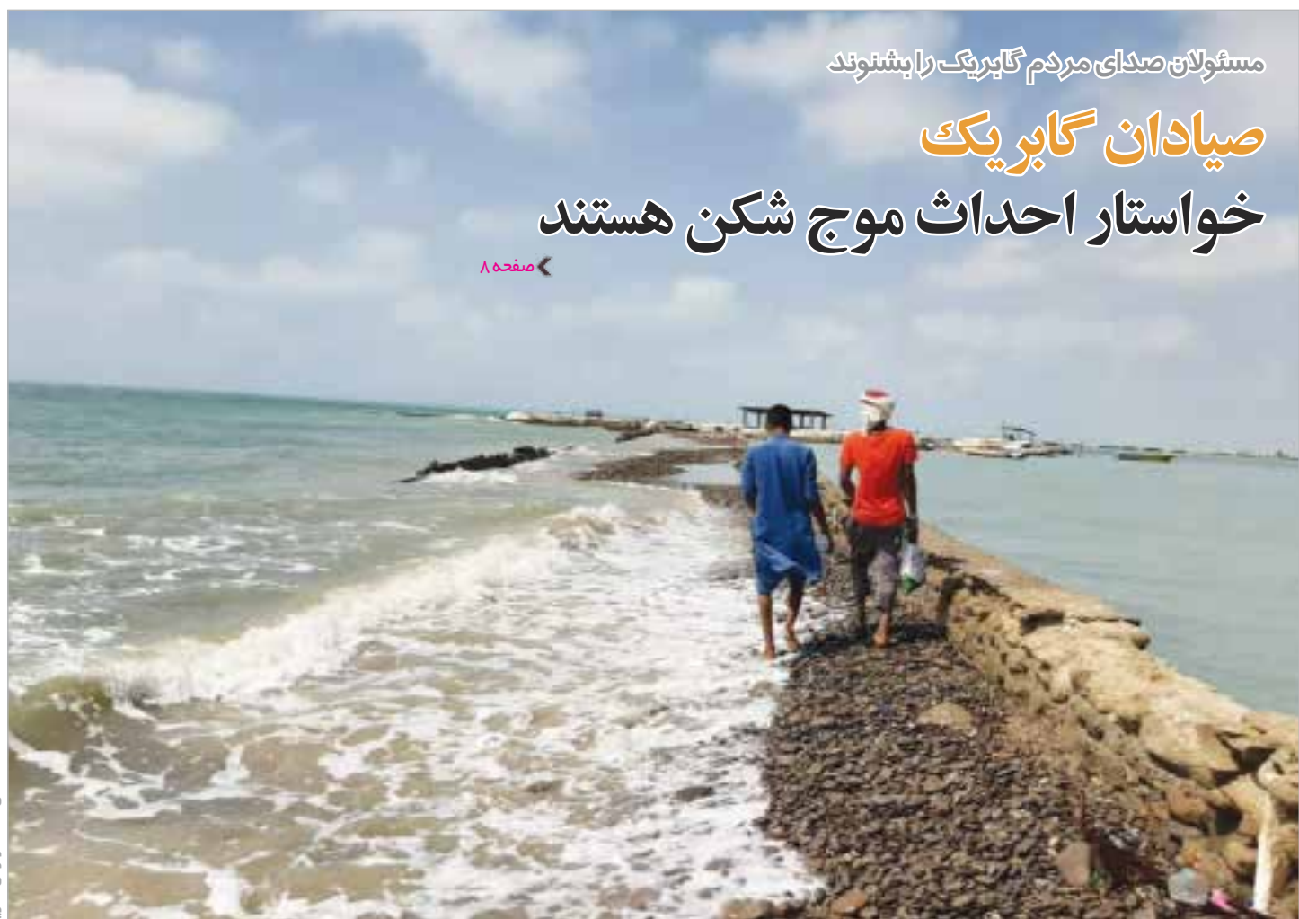
مستولان صدای مردم گابریک را بشنوند