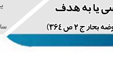
یکشنبه ۱۹ مرداد ۱۳۹۹

صنذلی خود را پیدا کردند آنجا بنشینند و کمتر به سطوح مشترک دست بزنند. هنگام نشستن بر صندلی فاصله خود را با سایر داوطلبان و مراقبین حفظ کنند. با حفظ فاصله اجتماعی احتمال انتقال بیماری تا حد زیادی کاهش می‌یابد.وی با اشاره به اینکه بیش از این مرسوم بود داوطلبان پاسخ‌های خود را بعد از امتحان با یکدیگر جک کنند، اظهار کرد: انجام این کار در شرایط فعلی مناسب نیست. بهترین شیوه آن است که پس از اتمام امتحان بسویون از دست و تجمع حوزه امتحانی را ترک کنند.فرهادی درباره اقدامات ناظرین حوزه های امتحانی، تصریح کرد: ناظرین باید هنگام ورود و خروج از تجمع جلوگیری کنند و اگر برگه خوداظناری اظهار کنند و اگر برگه خوداظناری اظهار کرد: البته اگر داوطلبی دچار افت قند شود می‌تواند از خوراکی شخصی خود استفاده کند. در پروتکل‌های یاد شده هم تاکید شده است که تنها ارائه آب به شکل بطری به داوطلب مجاز است و گذاشتن آب سردکن و دادن آب با لیوان ممنوع است.به گزارش ایسنا، فرهادی ادامه داد: ما سیستم ناظرین را با سازمان سنجش تبادل کردیم و تقریباً در تمام حوزه‌ها ناظر بهداشت محیط از مرکز بهداشت مستقر خواهیم کرد. این افراد در قبل، حین و بعد از آزمون به مسئول حوزه کمک مشاوره‌ای و کارشناسی می‌دهند.