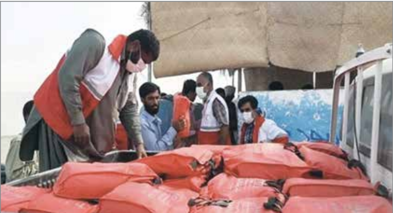
سال نوزدهم شماره ۳۳۸۵

به گزارش فارس، در حال حاضر نبود برق و آب بهداشتی مناسب در گرمای تابستان و اسکان مناسب، از مهم ترین دغدغه‌های این مردم سیل‌زده به‌شمار می‌رود.هم‌اکنون اقداماتی از سوی نیروی دریایی سپاه در این منطقه سیل‌زده در حال انجام است و دریادار علیرضا تنگسیری فرماندهی این نیرو، شخصاً جهت ساخت و ساز و کمک‌های معیشتی به‌طور مستمر پای کار است.گروه‌های جهادی نیز تمام وقت در کنار مردم این روستا حضور دارند تا شرایط زندگی عادی فراهم شود.