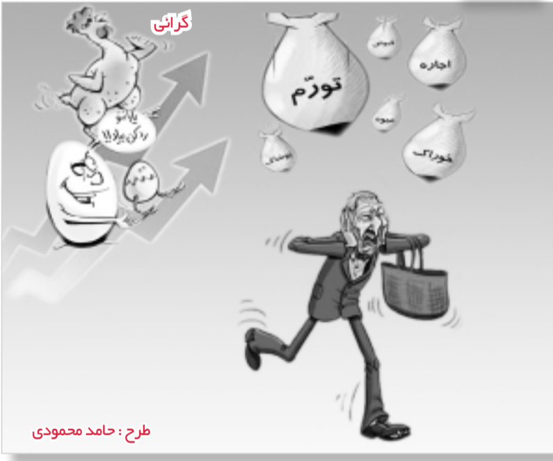
طرح : حامد محمودی