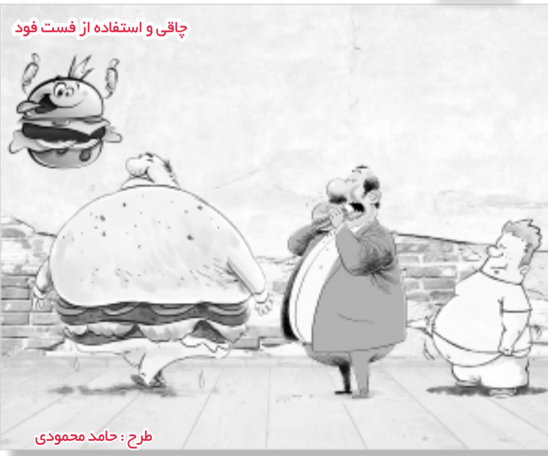
طرح : حامد محمودی