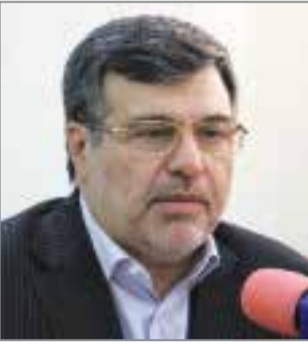
همتی - استاندار هرمزگان