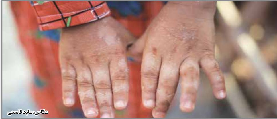
عکاس: عبد قاسمی