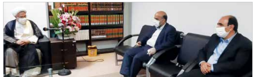
گروه خبر // نماینده ولی فقیه در استان هرمزگان گفت: مالیات مطمئن ترین و پایتبات ترین منبع در آمد کشور است.

به گزارش خبرنگار دریا، حجه الاسلام والمسلمین دکتر عبادی زاده در دیدار با مدیرکل معان و جمعی از کارکنان اداره کل امور مالیاتی هرمزگان به مناسبت هفته مالیات و فرهنگ سازی مالیاتی ضمن تبریک این هفته، اظهار داشت: مالیات از منابع درآمدی مطمئن و پایداری است که می‌توان کشور را در شرایط مختلف و به خصوص شرایط بحرانی اداره نماید. امام جمعه بندرعباس با اشاره به اینکه در چشم انداز کشور ما درآمدهای نفتی در جایگاه پس از درآمدهای مالیاتی قرار دارند، بیان داشت: با برنامه‌ریزی انجام شده و مسیر درست و خوب ریل گذاری شده در سازمان امور مالیاتی جهت تامین درآمدهای مالی کشور و پیشی گرفتن از درآمدهای نفتی شاهد رشد خوبی در این مسیر هستیم. نماینده ولی فقیه در هرمزگان ضمن تشکر و قدر دانی از عملکرد مدیر کل و کارکنان اداره کل امور مالیاتی هرمزگان، ایراد داشت: مدیر کل و کارکنان این اداره کل در سراسر استان، ماموریت و وظایف خود در دستگاههای مالیاتی استان را به خوبی انجام داده‌اند. عبادی زاده افزود: مدیر کل امور مالیاتی هرمزگان، از جمله مدیران با دغدغه استان است که همیشه در چارچوب قوانین در راستای توسعه استان و مشارکت در امور اجتماعی اقدامات موثری انجام داده‌اند. عبادی زاده در ادامه این دیدار بر وصول مالیات شرکت ها و دستگاههای دولتی در استان تاکید کرد و گفت: ما مالیات آن ها در استان های دیگر وصول