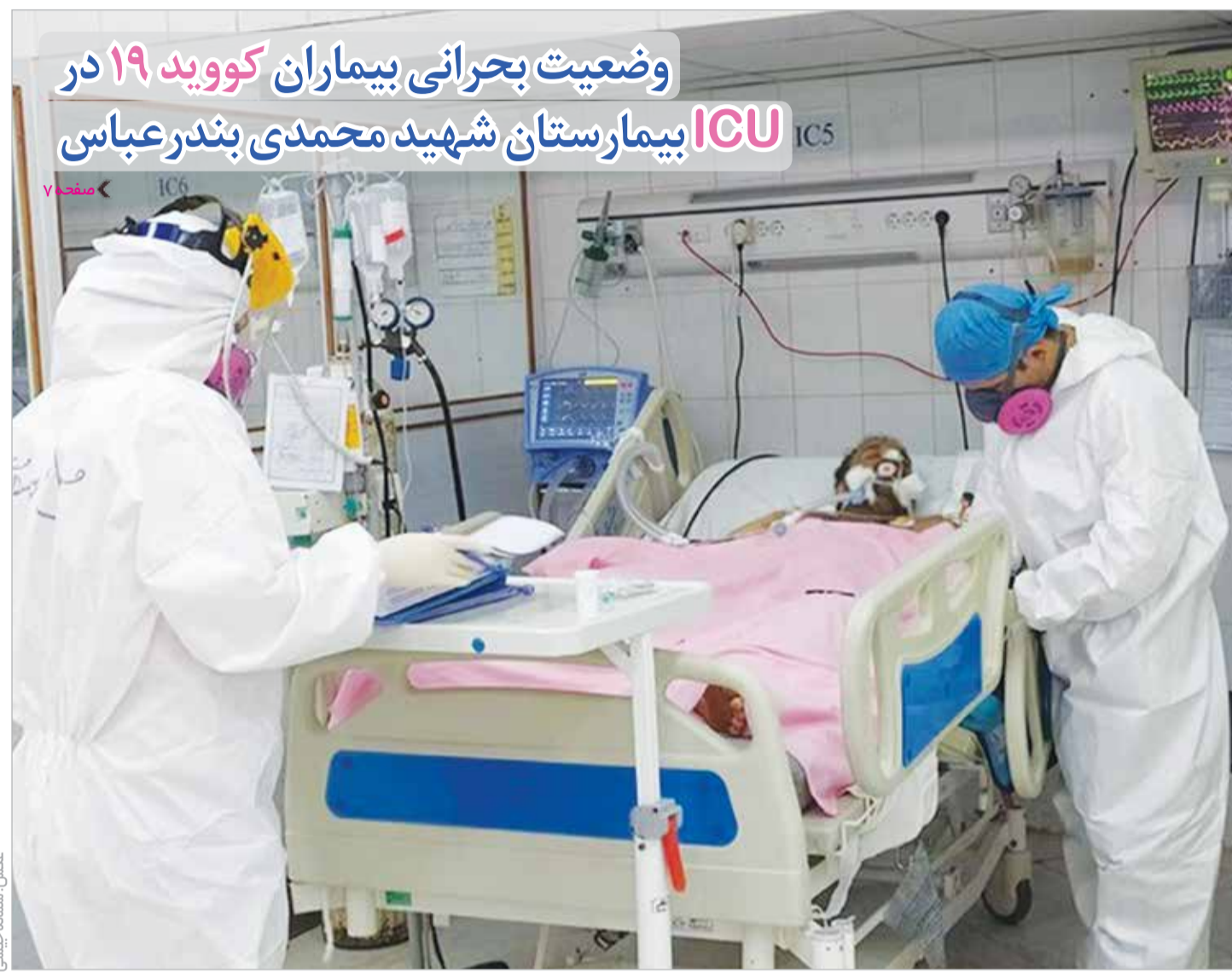
وضعیت بحرانی بیماران کووید ۱۹ در ICU بیمارستان شهید محمدی بندرعباس

ابتلای ۱۱۸ نفر از پرسنل درمانی مدیریت درمان هرمزگان به کووید ۱۹