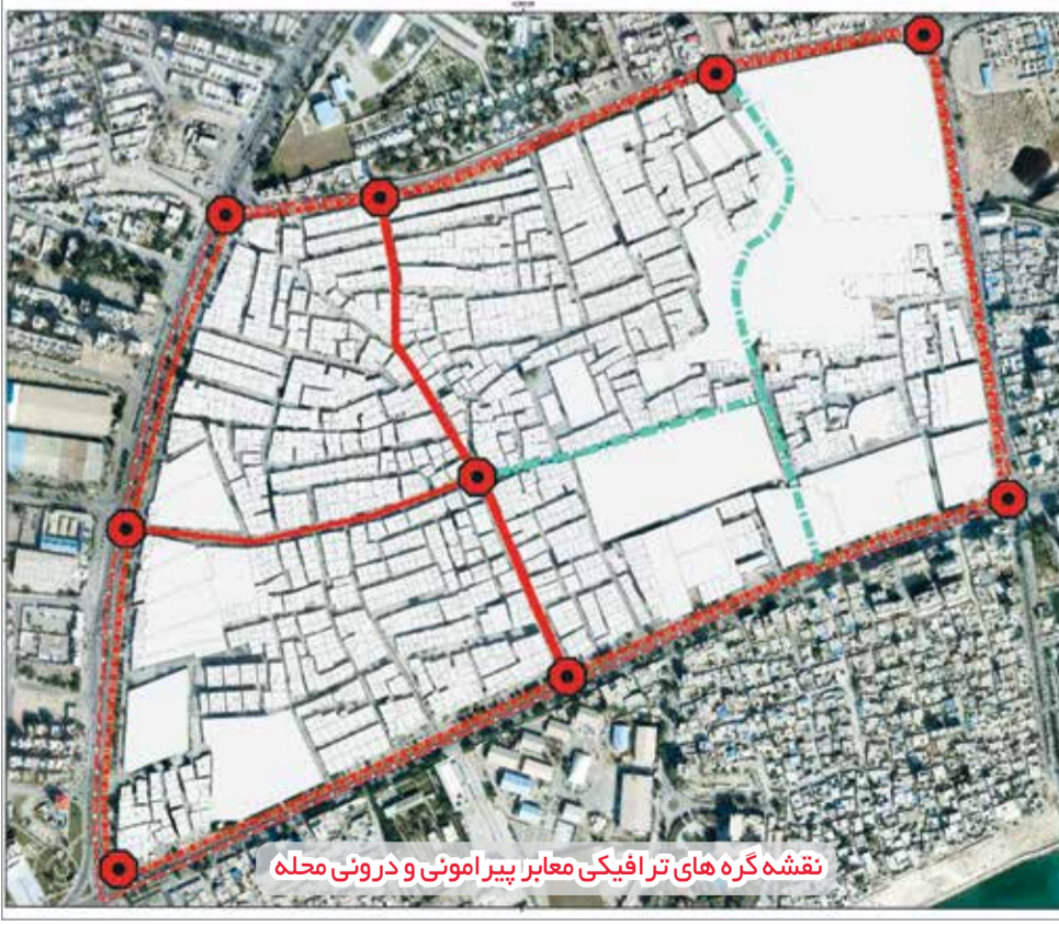
نقشه گره های ترافیکی معابر پیرامونی و درونی محله