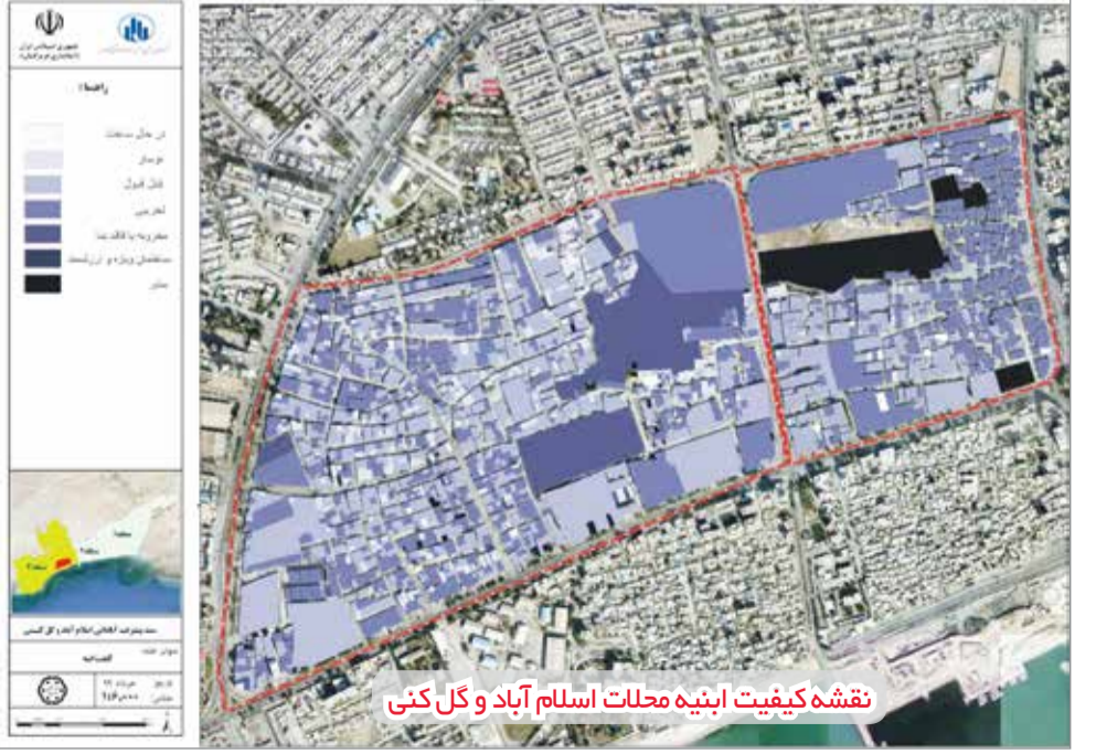
نقشه کیفیت اینیه محلات اسلام آباد و گل کنی

فعالیت عمرانی باشند آن را تبدیل به زخمی مهلک در توسعه محله می کند؛ آنچنان که در برخی نقاط نه تنها بازگشایی مشکلات را به سمت رفع مسئله جهت نداده است، بلکه تشنه ای بر ریشه زدن کالبد محله نیز شده است. وی افزود: اثرات بازگشایی معبر بر حوزه های مختلف اقتصادی، اجتماعی، حقوقی و ... در محلات کم برخوردار باید دیده شود. محله اسلام آباد و گل کنی از نظر قرارگیری در موقعیت شهری بندرعباس با توجه به نزدیکی به ساحل و مرکز شهر دارای اهمیت خاصی است که فقط به دو بعد نقش بازگشایی بر تغییر الگوی بافت نامناسب شهری (فرسودگی بناها) و فواید بازگشایی معبر در حل مشکل گره های ترافیکی حوزه غرب شهر بندرعباس اشاره می کند. مدیر دفتر تسهیلاتی و توسعه محلی اسلام آباد و گل کنی بندرعباس گفت: پس از استقرار دفتر تسهیلاتی و توسعه محلی در سال ۱۳۹۷ در محله اسلام آباد و گل کنی مرجع ساکنین مبنی بر پیگیری بازگشایی معبر دوم محله (پس از بازگشایی معبر اسلام آباد در سال) به صورت مداوم استمرار داشت تا در همان سال تدبیری اندیشیده شد که مسئله بازگشایی خیابان دوم با نگاه اجتماعی و تجدید نظر در طرح تفصیلی