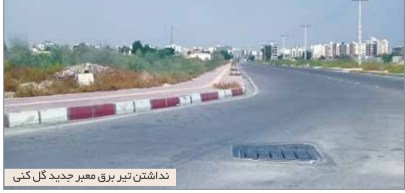
نداشتن تیر برق معبر جدید گل کتی