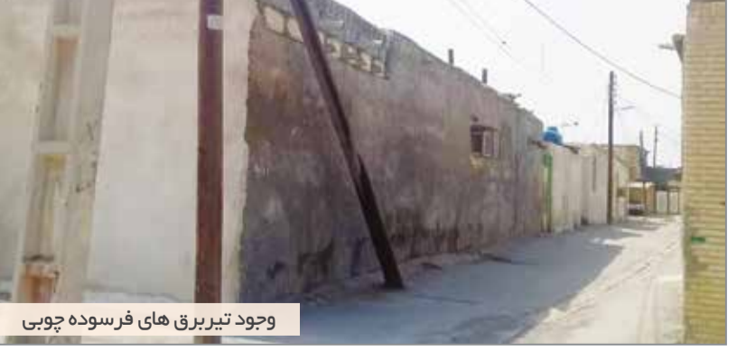
وجود تیربرق چوبی های فرسوده چوبی