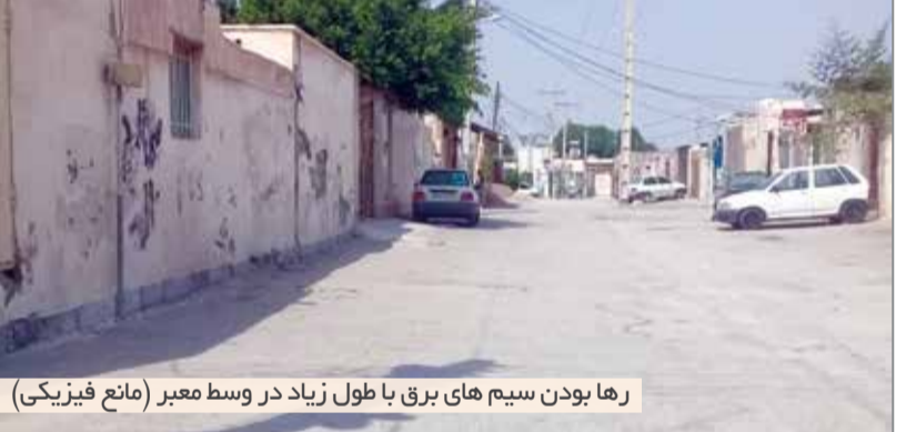
رها بودن سیم های برق یا طول زیاد در وسط معبر (مانع فیزیکی)