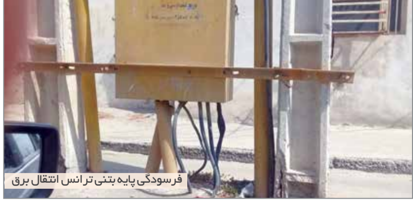
فرسودگی پایه بتنی ترانس انتقال برق