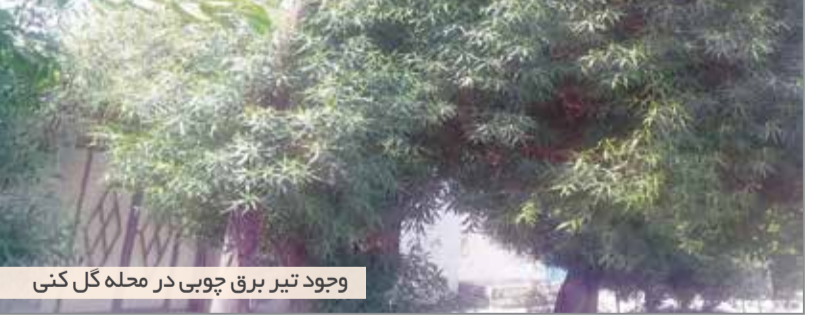
وجود تیر برق چوبی در محله گل کتی