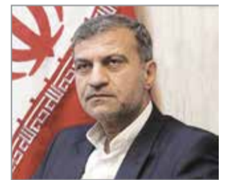
ادامه از تیتز یک نایب رئیس کمیسیون انرژی مجلس شورای

اسلامی ادامه داد: امروز تمام استان‌های کشور از نحوه مدیریتی رئیس جمهور شکوه دارند، در استان هرمزگان نیز بیشترین بی‌حرمتی را از سوی دولت آقای روحانی شاهد بوده‌ام. مردم هرمزگان، پالایشگاه، صنایع و مناطق آزاد دارند اما اشتغال و اقتصاد، پدیده‌است