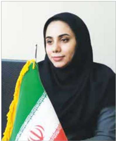
گلابه کارشناس اقتصادی دفتر تسهیلگری اسلام آباد و گل کتی بندرعباس

ثواب انتشار حدیث روز تقدیم به ، بنیانگذار روزنامه دریا زنده یاد حاج ایوب دبیری نژاد