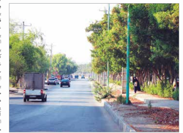
واحد آموزش سازمان مدیریت پسماند شهرداری بندرعباس

خیابان ها و جاده‌ها یکی از عوامل توسعه یافتگی جوامع بشری قلمداد می‌شود به طوری که اگر یک شهر دارای خیابان های خوب و سالم باشد معلوم می‌شود که آن شهر به سستی پیش می‌رود که رفاه را برای شهروندان به ارمغان می‌آورد و اگر از این نظر دور باشد پیداست که آن شهر محروم بوده و توسعه یافتگی در آن کم است. اما یکی از نکاتی که باعث می‌شود که خیابان‌های شهر نظم داشته باشند، اجرای صحیح قوانین در آن شهر است. اگر در شهری قوانین به درستی اجرا شود و شهروندان نیز خود را مازم و رعایت قوانین بدانند این شهر مطلوب است.کلاشهر بندرعباس به دلیل اقتصادی بودن، یکی از شهرهای کشور محسوب می‌شود که در آن اقوام مختلف زندگی می‌کنند که هر کدام با آداب خاصی بزرگ شده و برای کار و تجارت به این شهر آمدنند. به همین دلیل رعایت قوانین در چنین شهری سخت‌تر انجام می‌شود.همین هجوم جمعیت به کلاشهر بندرعباس و افزایش تعداد خودرو در آن باعث شدد که مسولان شهری برای کاهش بار ترافیکی در شهر، دست به تغییراتی در خیابان‌های آن زده تا ترافیک روان شود. از یکطرف کردن خیابان‌های اصلی گرفته تا