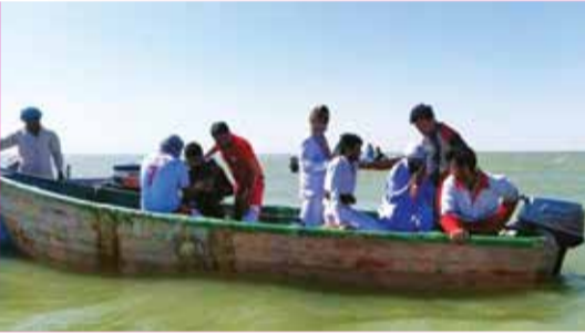
گفت:زن جوانی که برای نجات پسرپریچه خردسالش به داخل رودخانه سیستان انتظامی هامون سیستان و بلوچستان

محدوده (نهرآب)این شهرستان به آب زده بود به دلیل آتشفشان بونون به فئون شنا جان باختن سرهنگ حسین نوری فرید در این‌باره اظهار کرد: در بررسی‌های مأموران کلاتری۱۱ مشخص شد سرپچه‌ای دوو نیم ساله که به همراه خانواده‌اش برای تفریح در کنار رودخانه رفته بود به داخل آب سر خورد و مادر ۲۵ ساله‌اش برای نجات فرزندش به داخل آب رفته تا کودک خود را از آب بیرون بکشد که متأسفانه به دلیل آشنا نبودن با فنون شنا در رودخانه گرفتار و غرق می‌شود. رسول راشکی مدیر عامل جمعیت هلال احمر سیستان و بلوچستان نیز در گفت‌وگو های هرمنند ، زک و زایل ادامه دارد.