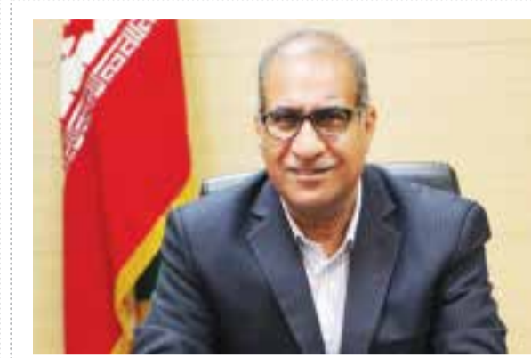
■ عزیزاله کناری - فرماندار بندرعباس

گروه گزارش // درحالی که قدمت میدان میوه وتره بار فعلی بندرعباس به قبل از انقلاب برمی گردد و با افزایش جمعیت و وسعت شهر بندرعباس به عنوان پایتخت اقتصاد کشور در حدود نیم قرن اخیر؛ اما این میدان تغییر محسوسی نداشته است و بدلیل اینکه این میدان پاسخگوی نیاز شهر ۸۰۰هزار نفری بندرعباس و روستاها و بخش های اطراف نیست، ضرورت بهره برداری از میدان جدید را دوچندان می کند. همچنین موقعیت فعلی میدان میوه وتره بار بندرعباس باعث بروز مشکلاتی از جمله ایجاد ترافیک در مسیر ورودی و خروجی شرق استان شده و قفل شدن ترافیک در ساعاتی از شبانه روز را به همراه داشته و رفت و آمد آمبولانس، خودروهای آتش نشانی و امدادی و... را نیز قفل می کند. از سال های گذشته بحث احداث میدان جدید میوه و تره بار بندرعباس مطرح گردید و این پروژه عمرانی از سال ۹۲ وارد فاز اجرا شد که بالاخره در اواخر سال گذشته بطور کامل آماده