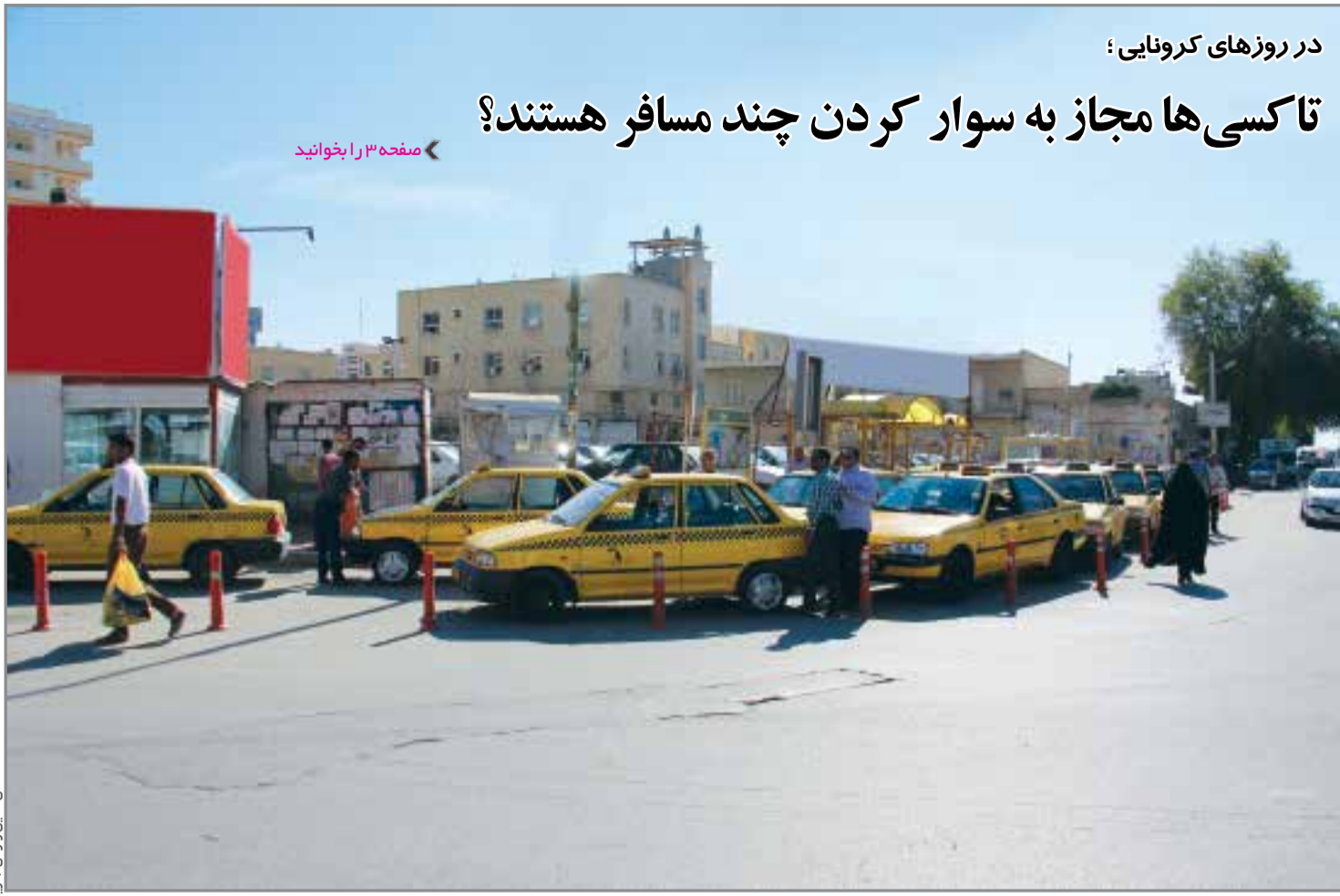
عکس: امین آزادی لاری