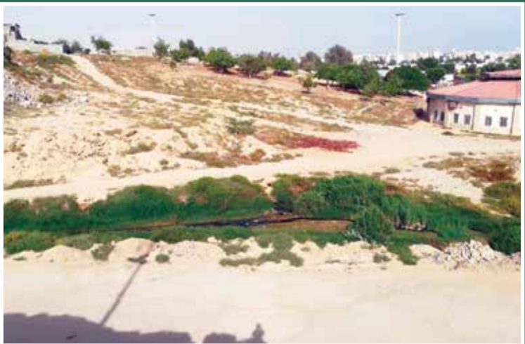
فاضلاب های روان که باعث رویش گیاهان و... شده اند

ساماندهی خودروهای مسافر شخصی، برخلاف رانندگان تاکسی توانسته اند از بیمه رانندگان استفاده کنند. در حال حاضر هم که استهلاک خودرو بالاست و دخل و خرچش با هم نمی خوانند و مانند مافی همکاران مسافرتی توانسته شغل مناسبی داشته باشند. وی معتقد است اگر که طرح مسکن مهر تمام می یافت، علاوه بر خانه دار شدن اقشار محروم و متوسط جامعه، اشتغالزایی بالایی زیادی را نیز به همراه داشت و افرادی مانند وی و هم محله ای هایش بیکار نمی شدند.