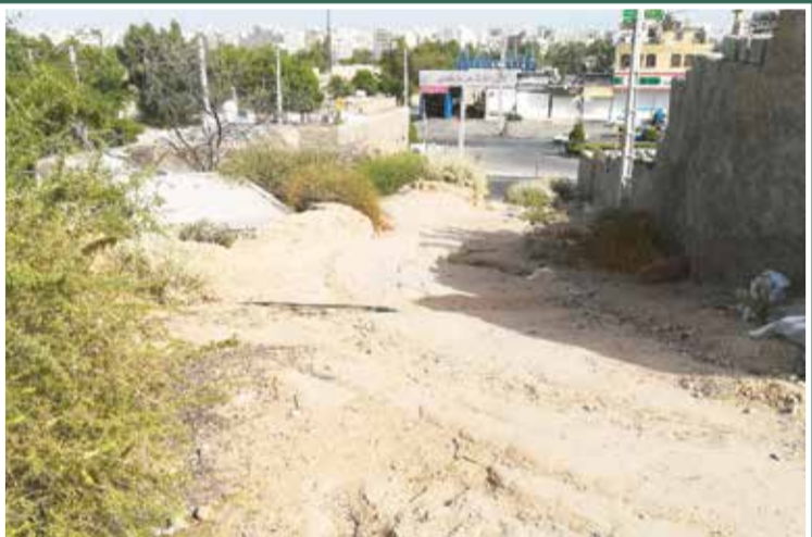
ورودی قدیمی ضلع جنوب شرقی محله