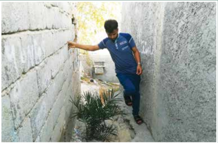
رفت و آمد در کوچه ها به سختی صورت می گیرد