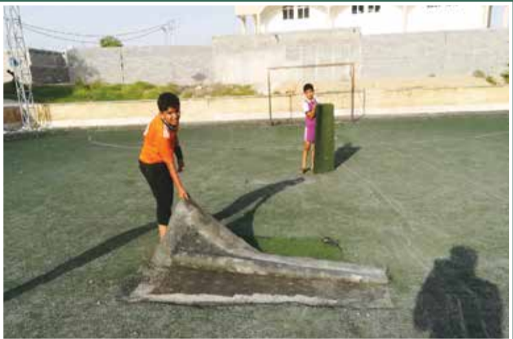
چمن های فرسوده، پاره و حادثه ساز زمین ورزشی محله