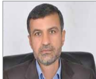
همه گیری است لذا از مردم هم می خواهم همچنان در خانه بمانند و به نکات بهداشتی توجه کنند.

این موضوع مخالف هستیم و به رئیس جمهور می گویم شما دست از سر مردم هرمزگان بردارید ما نمی خواهیم مردم هرمزگان دچار استرس و نگرانی شوند و رئیس جمهور موظف است پاسخ قانع کننده ای به افکار عمومی بدهد. نماینده مردم هرمزگان در مجلس شورای اسلامی کم بودن آمار ایلات به ویروس کرونا در استان هرمزگان را به دو علت رعایت و همراهی خوب مردم با کادر درمانی و مسئولان و همچنین کم بودن میزان تست در استان دانست و گفت: کم بودن آمار ایلات به ویروس کرونا در استان نشان دهنده وضعیت سفید نیست، کرونا ویروسی ناشناخته است و به سرعت در جهان در حال انتشار و