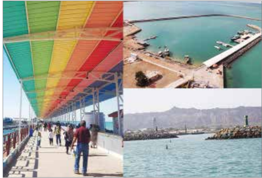
بندرگاه هرمز در استان سیستان

معاون بهبود تولیدات گیاهی جهاد کشاورزی هرمزگان عنوان کرد