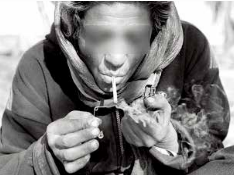
چاره ای اندیشید.

هر چه به سمت جلومی روییم سن اعتیاد کاهش پیدا کرده واعتیاد زنان رو به افزایش است و تا با مسائل بحرانی تر روبرو نشده ایم باید مسئولین با برنامه ریزی از این مسئله جلوگیری کنند.