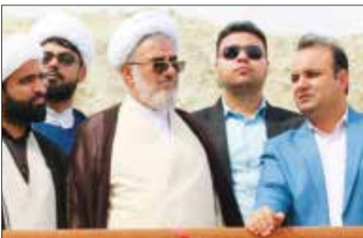
نماینده ولی فقیه در هرمزگان در جریان بازدید از این منطقه:

افق آینده منطقه ویژه اقتصادی پاریان را روشن می بینم