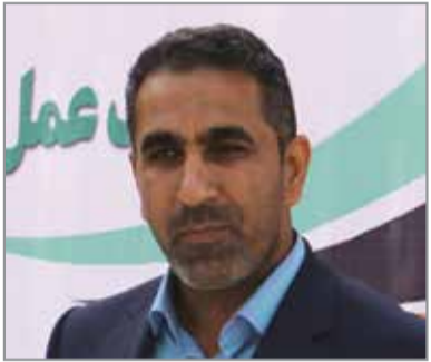
■ خادم / رئیس سازمان فضای سبز بندرعباس

و زیبایی بر روی فضای سبز بر عهده هرس کاران است تا فضای سبز دلنشین تر باشد. ■ امین زارعی / دریا AMIN.ZCH2011 @GMAIL.COM