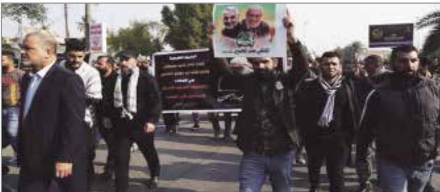
پیکر شهیدان سردار قاسم سلیمانی و ابومهدی المهندس و دیگر شهدای حشد شعبی بعد از طواف حرمین شهر مقدس کاظمین وارد میدان الحسینین در الجادریه در نزدیکی منطقه الخضر (سبز) شد و در آنجا با حضور مقامات عراقی تشییع شد. به گزارش ایسنا، خبرنگار بغداد ایوم گزارش داد، پیکرهای شهدای حمله پهبادی

در الجادریه بغداد منتقل شد؛ جایی که مقر حشد شعبی در آنجا قرار دارد. جمع کثیری از ساکنان بغداد و تعداد زیادی از رهبران حشد شعبی و مسؤولان سیاسی در میدان الحسینین برای استقبال از پیکر شهیدان حضور یافتند. در راستای برقراری امنیت منطقه خبرگزاری رسمی عراق (واع) گزارش داد، نیروهای امنیتی عراق به طور کامل پل الجادریه و مسیرهای منتهی به محل تشییع در منطقه الجادریه را بستند. همچنین اداره اطلاع رسانی حشد شعبی اعلام کرد، پیکر شهدای دیگر حمله آمریکا سردار سلیمانی و المهندس در شهر کاظمین هزاران عراقی شعار «مرگ بر آمریکا» و «مرگ بر اسرائیل» را سر دادند. پیکر این شهیدان بعد از کاظمین توسط تشییع کنندگان به سمت میدان الحسینین