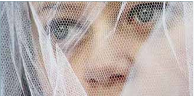
کارشناس ارشد دفتر بررسی‌های امور

حقوقی معاونت رییس‌جمهور در امور زنان و خانواده از تدوین لایحه جدید برای مقابله با کودک همسری خبر داد و گفت: این لایحه که حداقل سن ازدواج را برای دختران ۱۳ سال و برای پسران ۱۵ سال تعیین کرده است، با حمایت اعضای کمیته فرعی کمیسیون لوایح دولت به تصویب رسید.